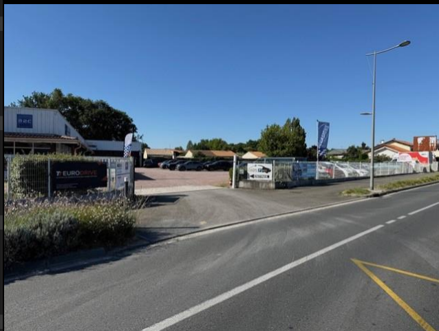
Centre de livraison – Point de rendez-vous pour les restitutions